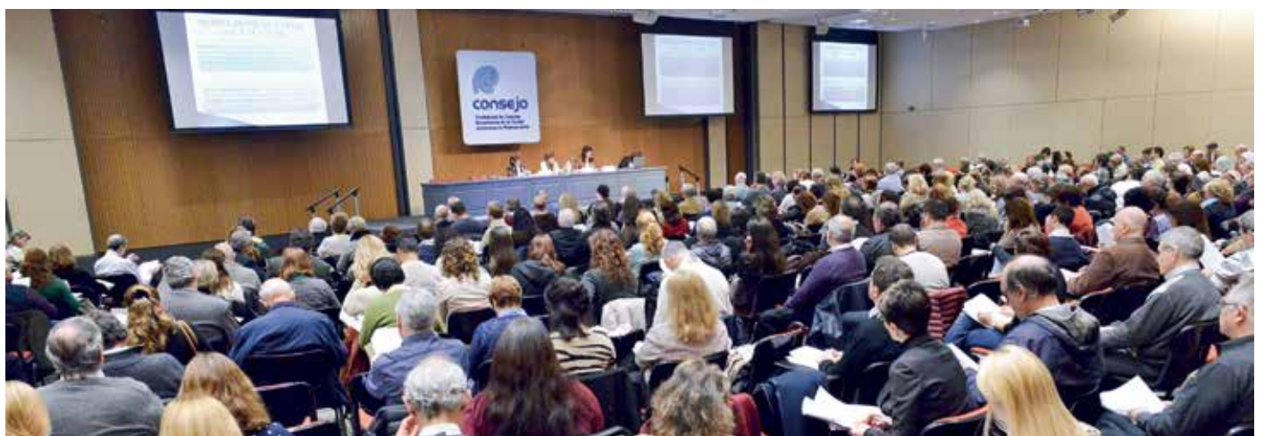
Nuestro salón Dr. Manuel Belgrano colmado demuestra el gran interés que la actividad generó en los profesionales.

Una de las cuestiones en las que puso énfasis la especialista fue en aclarar qué sucede con aquellos que tienen un inmueble en el exterior y obtienen una renta por la locación. Este no es un tema menor ya que, tras el blanqueo, muchos fueron los que quisieron despejar esta duda.