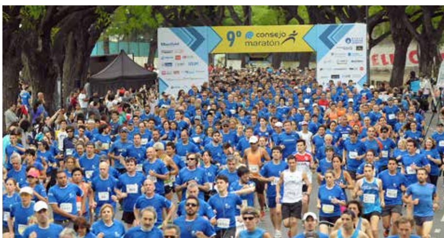
En 2016, más de 1.400 corredores disputaron nuestro clásico evento deportivo.

La carrera, en esta oportunidad, tendrá tres modalidades: dos competitivas, de 5 y 10 km, y la participativa, de 3 km, para que quienes aún no están muy entrenados puedan sumarse, incluso caminando. Como en las ediciones previas, contaremos con la categoría mamás con bebés en cochecito , de 3 km. Además, para este año fueron invitados a sumarse los estudios profesionales y empresas en pos de fomentar el trabajo en equipo y el compañerismo.