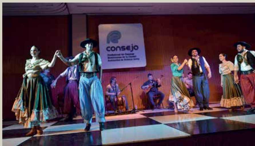
En la edición de 2016, el show de folklore fue uno de los momentos destacados de la noche.