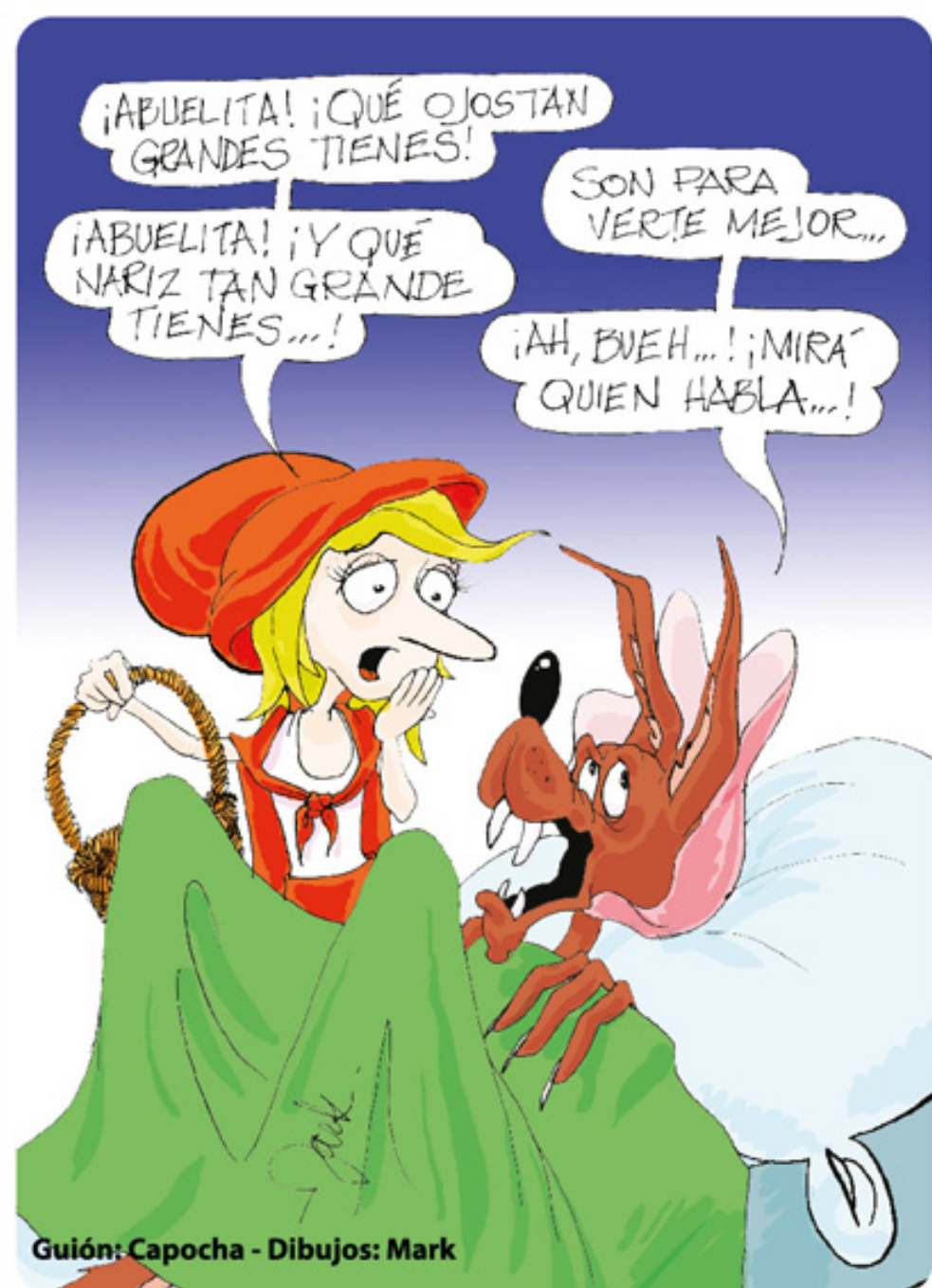
Guión: Capocha - Dibujos: Mark

Se prevé incorporar en el futuro otro tipo de documentación en función de los acuerdos que se vayan implementando con los distintos organismos.