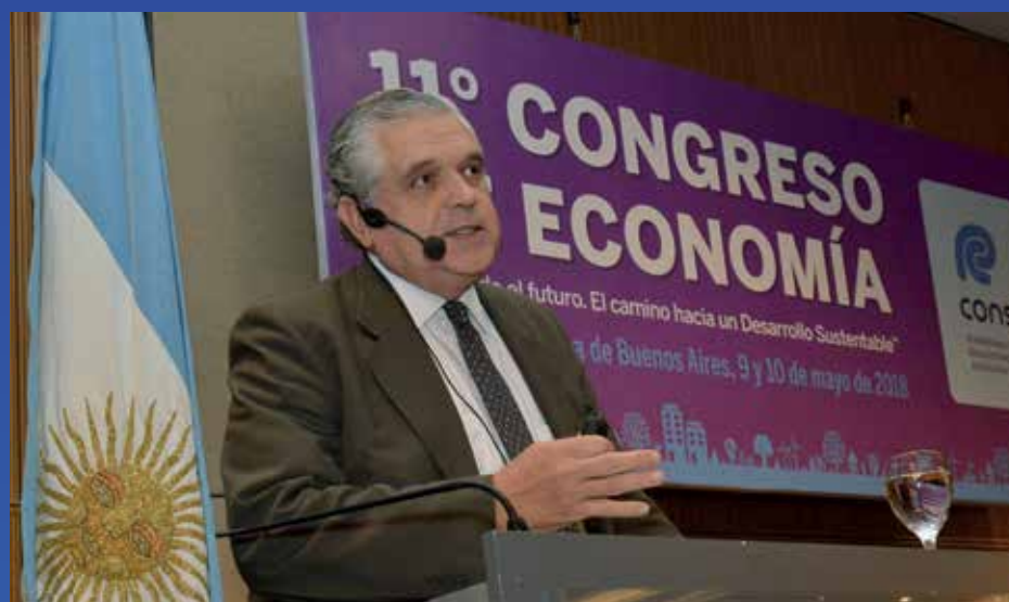
Ricardo López Murphy se explayó sobre la coyuntura y las dificultades del país en materia de inversión.

Al final, López Murphy advirtió que la élite política y cultural de muchos países latinoamericanos, en especial en la Argentina, parece estar enamorada del déficit público. Por eso, reflexionó: “Quizás sufrimos una variante del Síndrome de Estocolmo”.