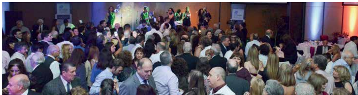
La Cena del Graduado coronó una semana de múltiples festejos para nuestros colegas.

Continuando con la tradición, el viernes 2 de junio a la mañana tuvo lugar el homenaje al Dr. Manuel Belgrano. Este acto conmemorativo, realizado en el mausoleo del prócer (situado en el convento de Santo Domingo, en el barrio de Monserrat), fue organizado en conjunto con la Facultad de Ciencias Económicas de la Universidad de Buenos Aires, el Colegio de Graduados en Ciencias Económicas y el Instituto Nacional Belgraniano.