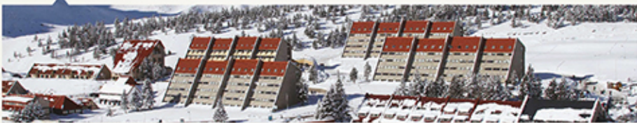
(*) Tarifa sujeta a disponibilidad y a modificación sin previo aviso.

Tarifa por persona en hab. Valle, base doble: $ 9.951,65 (*) final.