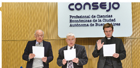
La oración conjunta de los líderes religiosos

Antes del broche final, que fue la Cena del Graduado, el jueves 6 tuvo lugar el merecido reconocimiento a los profesionales que ocuparon los cargos de presidentes y vicepresidentes de las comisiones académicas, profesionales, institucionales y operativas del Consejo.