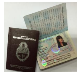
DNI LIBRETA Y TARJETA BORDÓ DIGITAL