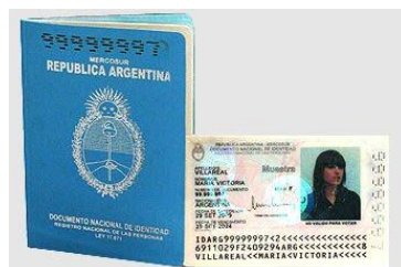
DNI LIBRETA Y TARJETA CELESTE DIGITAL