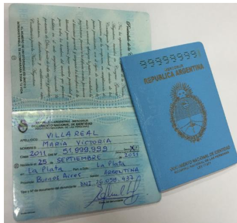
DNI CERO AÑO TAPA CELESTE CONFECCIÓN MANUAL (MANUSCRITO)